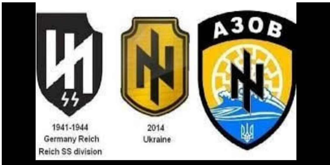
Рис. 2 Атрибутика украинских неонацистов и ее сходство с атрибутикой немецких нацистов прошлого века.